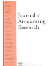
Journal of Accounting Research