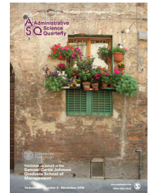
Administrative Science Quarterly