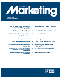
Journal of Marketing