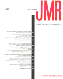
Journal of Marketing Research