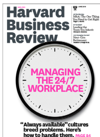
Harvard Business Review