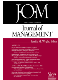
Journal of Management