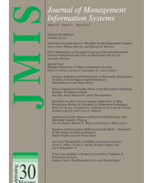
Journal of MIS