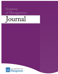
Academy of Management Journal Academy of Management Review