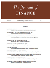
Journal of Finance