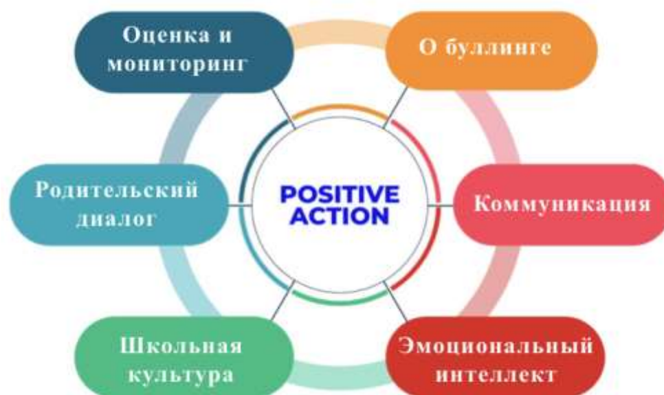
Рисунок 1 – Ключевые направления программы

Программа "Positive action" школы ABIS основана на шести ключевых направлениях, которые совместно способствуют предотвращению буллинга, улучшению общей атмосферы в школе и формированию позитивных социальных навыков учеников (Рисунок 1).