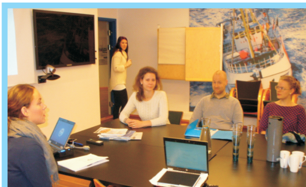
Практическое занятие в Тромсё

Программа Летней школы отличается насыщенностью и многообразием и состоит из прослушивания лекций, участия в практических занятиях, посещения компаний и организаций, функционирующих в сфере рыбохозяйственного комплекса фюльке Тромс и Мурманской области.