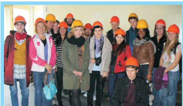
Участники Летней школы 2012

Это совместный проект в рыбной отрасли между Университетом Тромсё – Арктическим университетом Норвегии и МГТУ/МГГУ, реализуется с 2011 г.