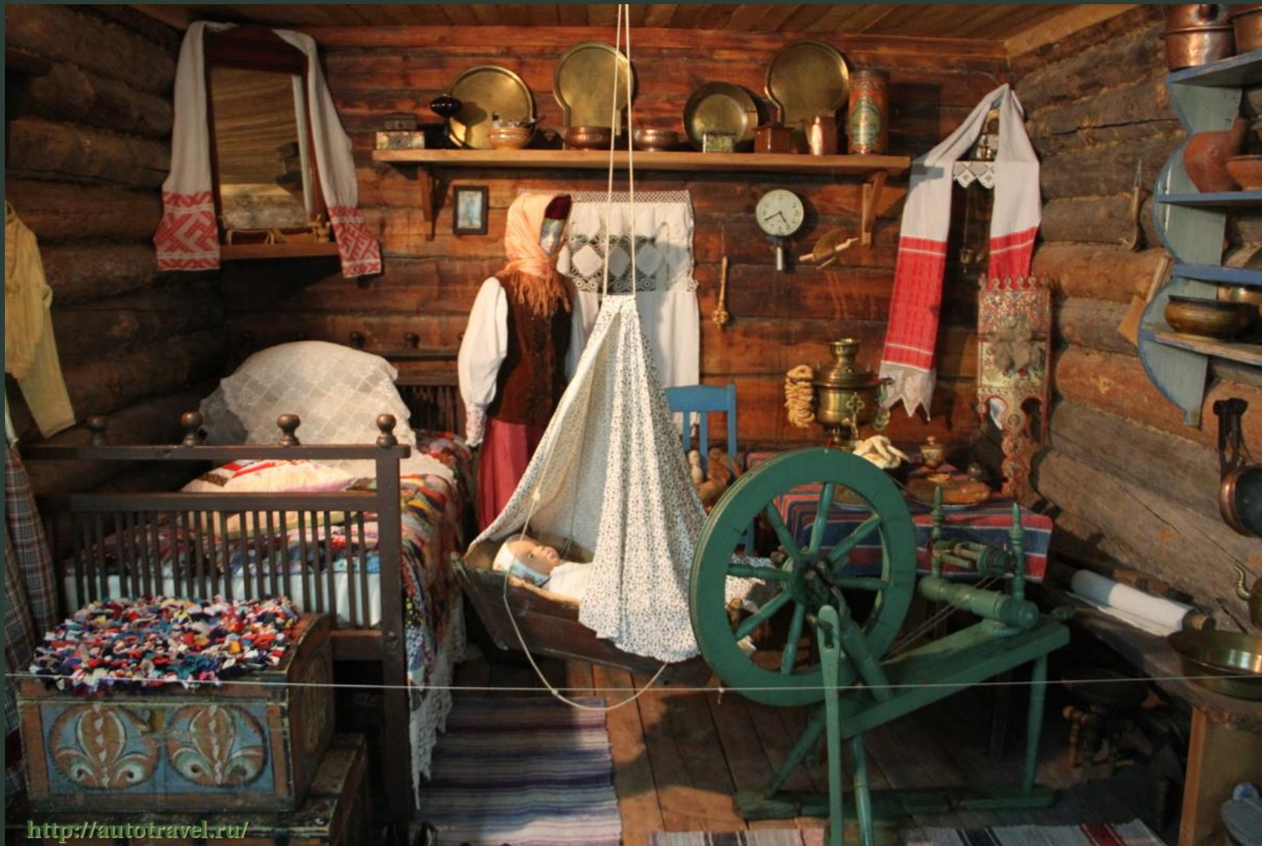
http://autotravel.ru/ Благодаря энтузиазму и патриотизму Юлии Сергеевны при школе был создан музей поморского быта