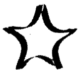
График проведения отборочного этапа Многопрофильной инженерной олимпиады «Звезда»

Отборочный этап проводится в форме выполнения олимпиадных заданий: