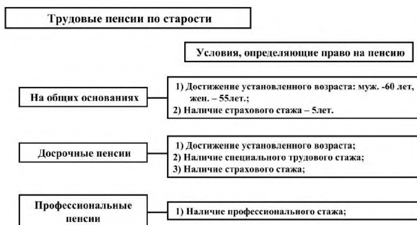
Рисунок 1 – Условия, определяющие право на пенсию

Слово «Рисунок», номер и наименование рисунка помещают посередине строки. К самим рисункам также применяется выравнивание посередине строки. Пример оформления рисунка приведен на рис. 1.