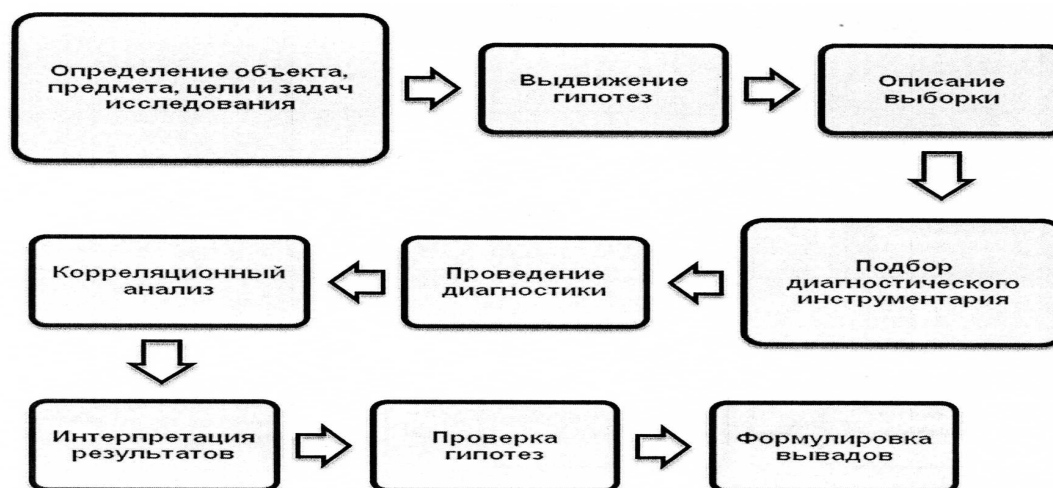
Рис. 2. Программа эмпирического исследования

Таким образом, любое исследование включает в себя необходимые этапы, совокупность которых представляет собой программу исследования. Программу эмпирического исследования можно представить в виде схемы (Рис. 2).