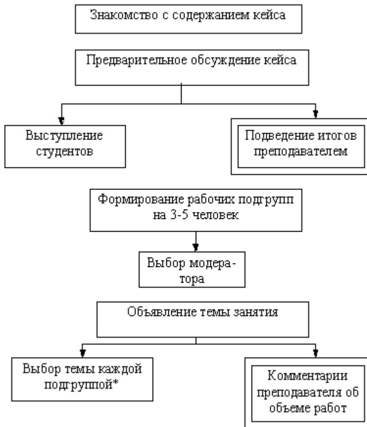
Стадия организации работы над кейсом

Последовательность организации и проведения занятий представлена на рисунках.