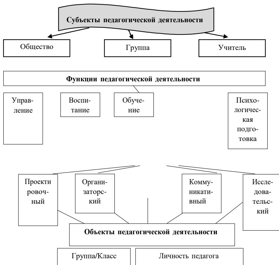
Схема 2. Педагогическая деятельность как общественное явление