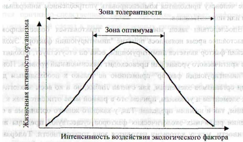
Рис. 1. Зависимость жизненной активности организма от интенсивности воздействия экологического фактора

Живые организмы по отношению к воздействию экологических факторов делятся на эврибионтов и стенобионтов. Эврибионты имеют широкий диапазон толерантности по отношению к воздействию какого-либо экологического фактора, стенобионты - узкий диапазон толерантности.